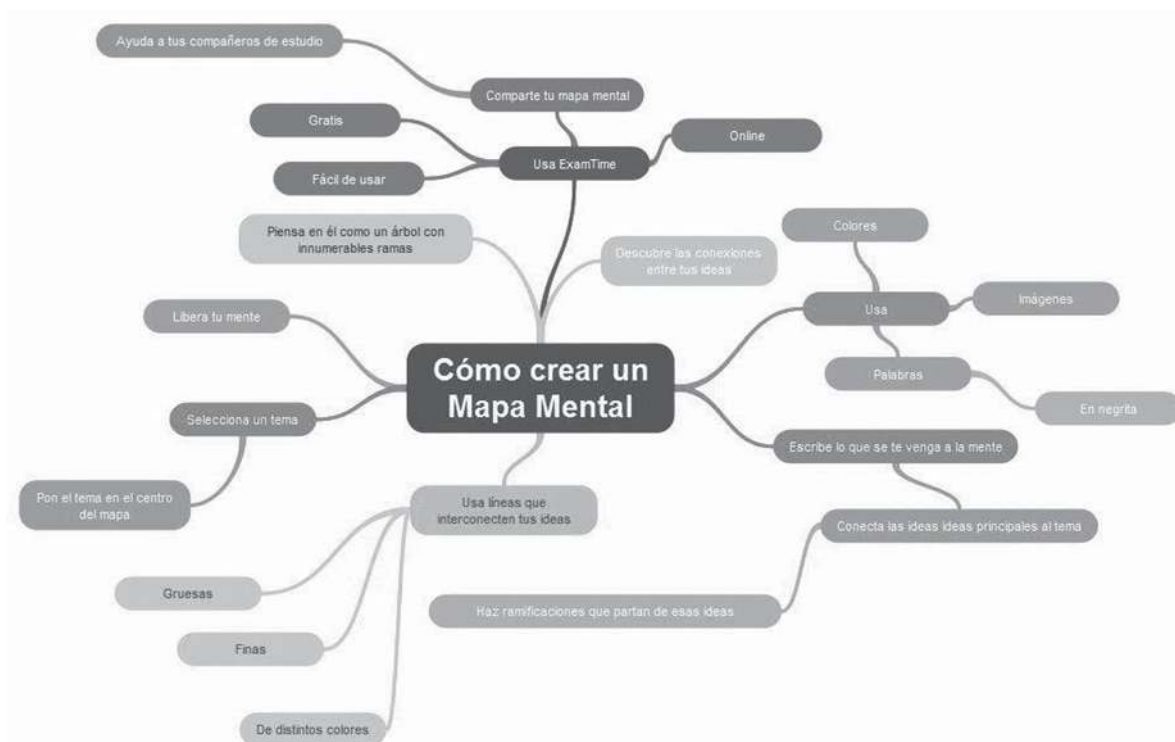
Figura 4 Forma de crear mapa mental