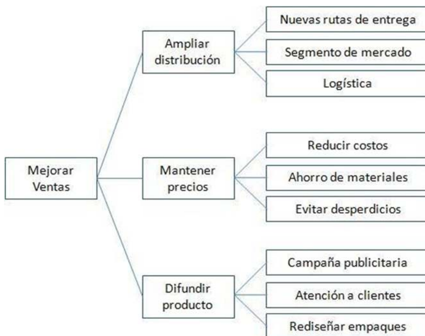
Figura 1 Diseño de Diagrama de árbol