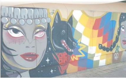
"América Latina de Pie" Idea y Organización: Agrupación Carlos Tereszecuk. Diseño y Realización: Daniela Azida. 25 de noviembre de 2019