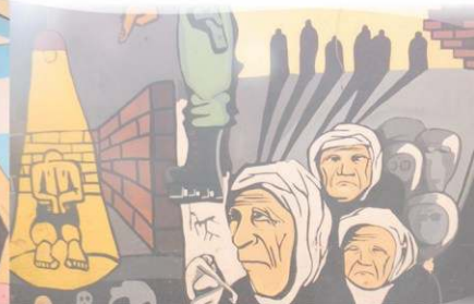
Memoria. Ubicado en un patio interno de la facultad - FHvCS