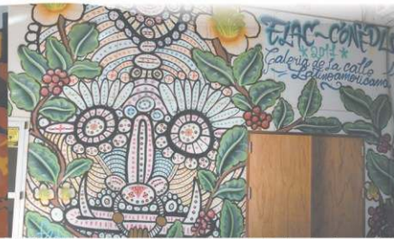
Realizado por Subone (Mateo Chaves) y Fado, donde partici- paron estudiantes. En el marco del XV Encuentro Nacional y VII Latinoamericano de Estudiantes de Comunicación. 2017