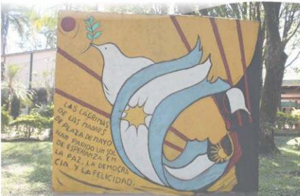
Vuelto a pintar en el 2021. por la Agrupación Freulba - FCF