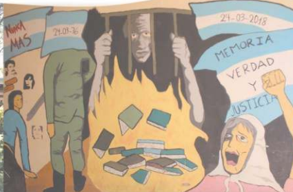
"Nunca Más" realizado por el Centro de Estudiantes de la Facultad de Ciencias Forestales (CEFE) en el 2018