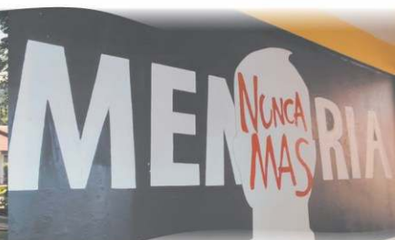
Nunca Más. Realizado por el Centro de Estudiantes FCEQyN, en marzo de 2017