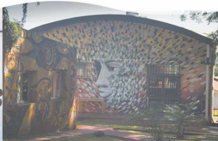
Mural por "Ice" (Luciano Gatti) Cruzacalle 2014 - FvD