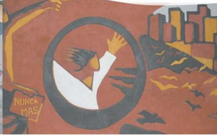
Mural Memoria de vida. Homenaje de la FHvCS a los compañeros universitarios asesinados o desaparecidos durante la última dictadura cívico-militar.