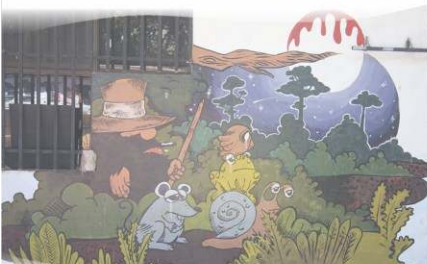
Homenaje a Hernan Castagno mural por "ASIR" (Ricardo Sánchez) - FvD